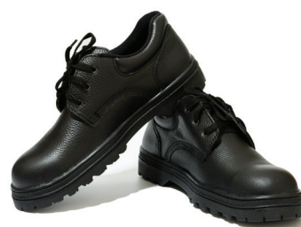
Sapatos de Segurança