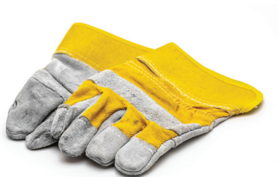
Luvas de Proteção Térmica