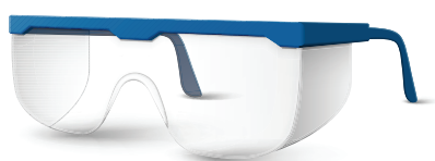
Óculos de Proteção

É recomendado que operadores e técnicos de manutenção utilizem EPI's (Equipamentos de Proteção Individual) adequados ao trabalho e com CA (Certificado de Aprovação).